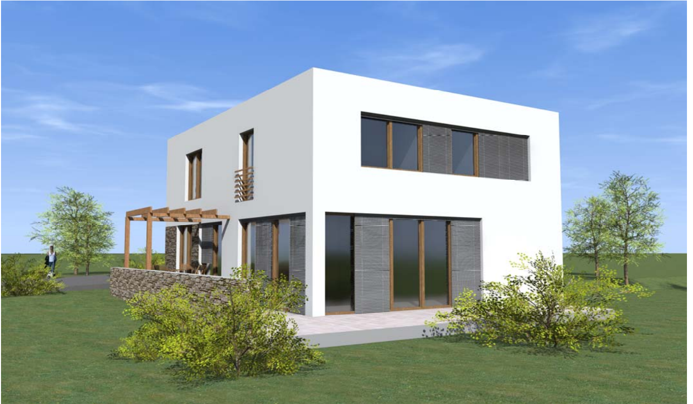
■ ■ VIZUALIZACE 01