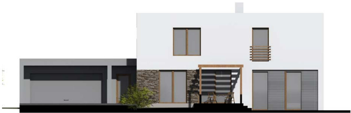
■ ■ POHLED ZÁPADNÍ