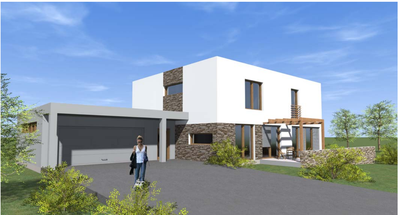
■ ■ VIZUALIZACE 02