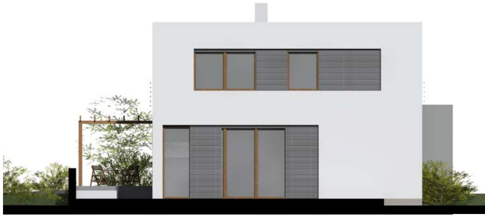
■ ■ POHLED JIŽNÍ