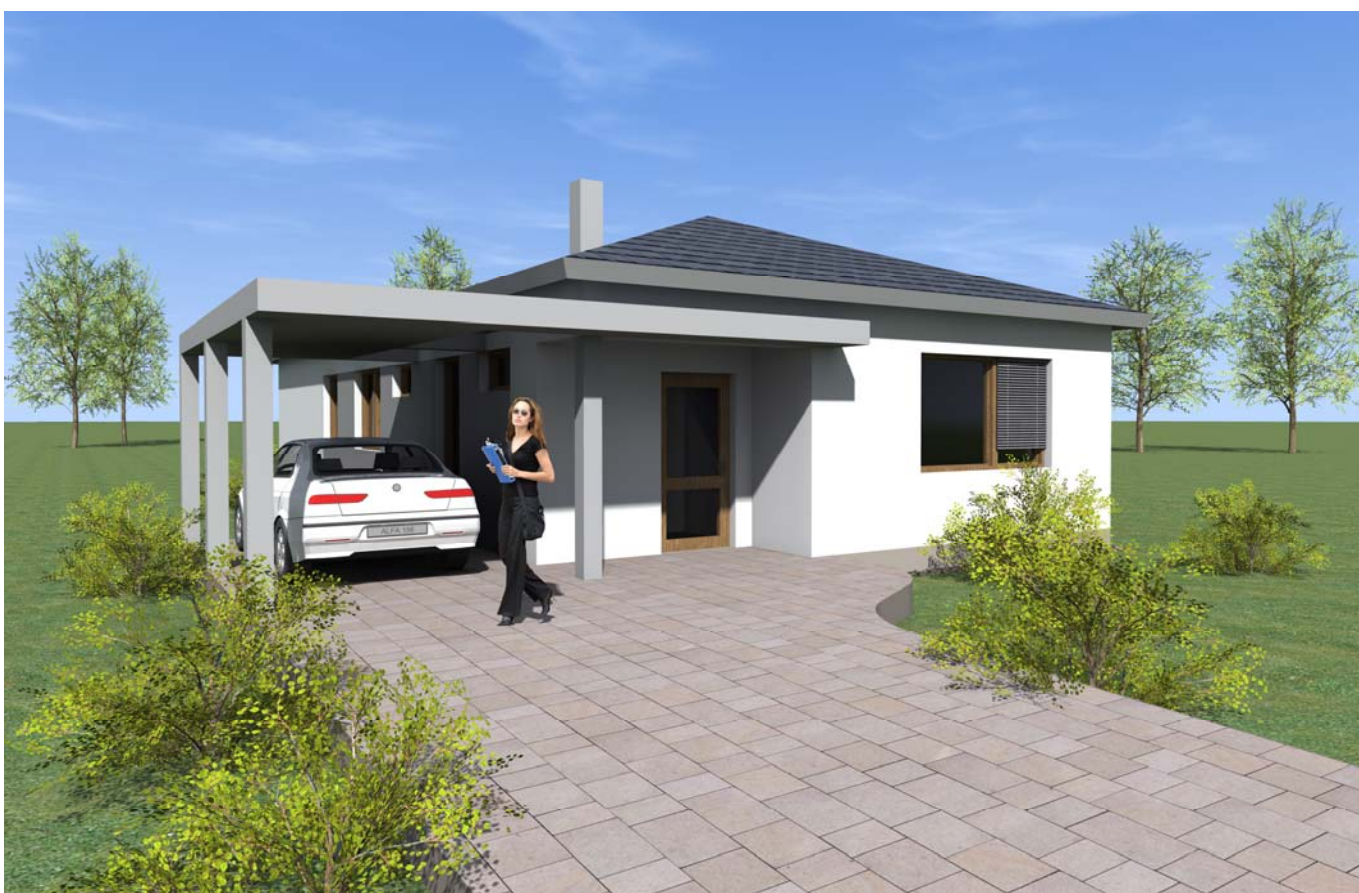
■ ■ VIZUALIZACE 02