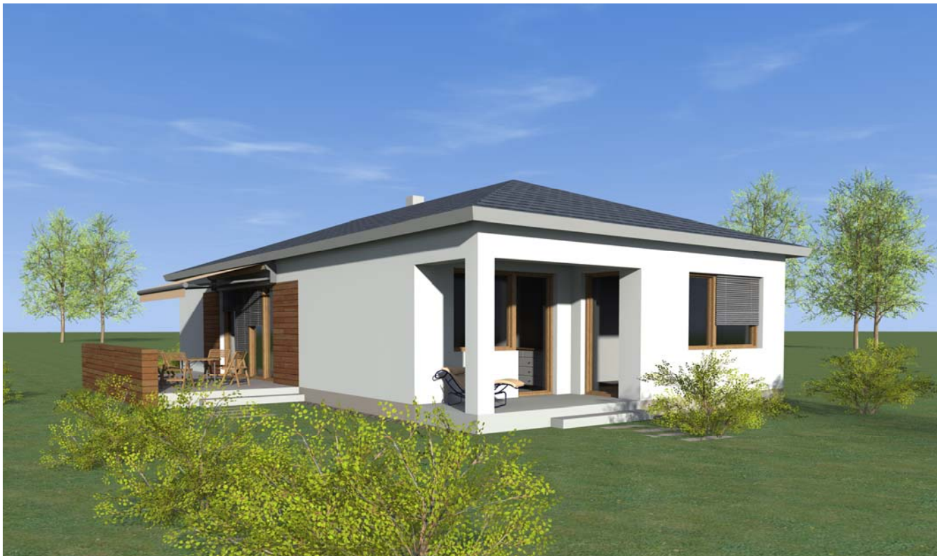
■ ■ VIZUALIZACE 01