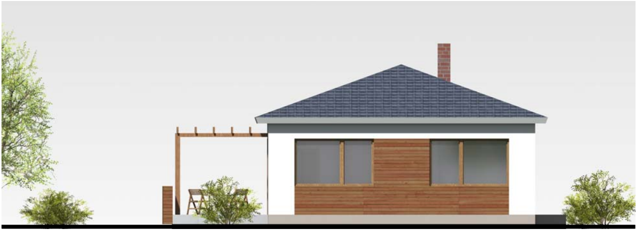
■ ■ POHLED JIŽNÍ