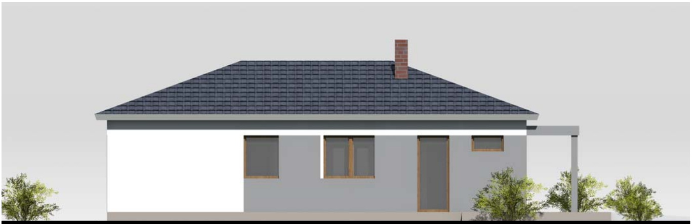
■ ■ POHLED VÝCHODNÍ