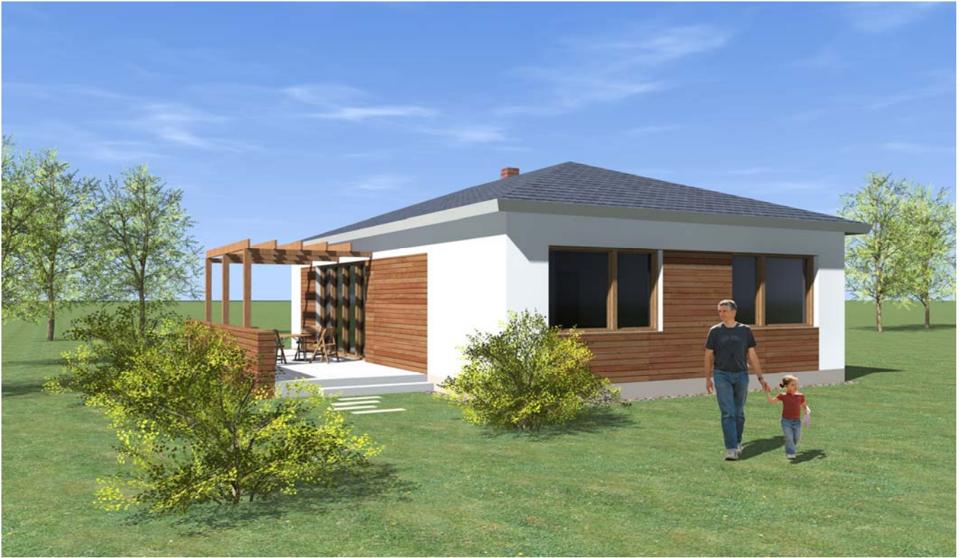
■ ■ VIZUALIZACE 01