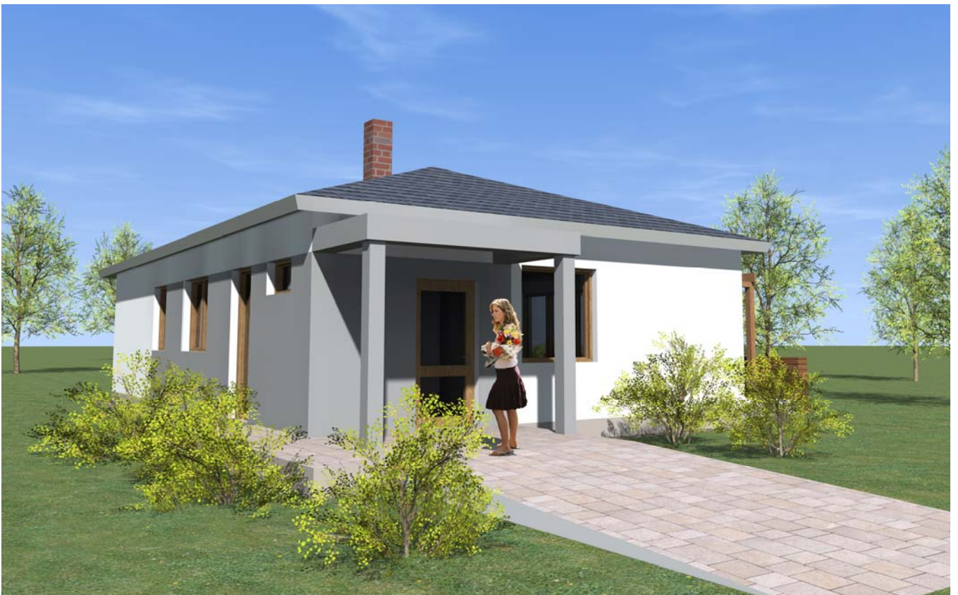
■ ■ VIZUALIZACE 02